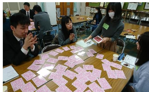
【 マッチングゲームの様子 】

今回は、子どものコミュニケーション能力を高めるために、日々行っている実践について、情報交換をしました。児童一人一人に役割を任せ、関わる場面を設定する実践や、朝の会などで、自分のことを話す場面を設定する実践など、それぞれの学校での取り組みを紹介し合いました。