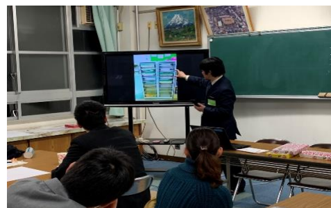
【 アイデアを共有する様子 】

各自で撮影し、持ち寄った写真を見せ合いながら、互いの学級経営のアイデアを共有しました。視覚支援について、教室の環境整備について、教材・教具についてなど、多くのアイデアを共有することができました。