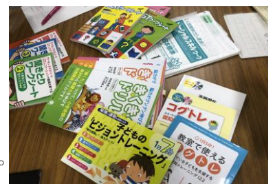
【参考になる本ばかりでした】

今回は、学習プリントや使用している教材・教具の情報交換を行いました。学習プリントの中には、産業科で使っていたものや就労に必要なスキルを高めるもの、通級指導教室で使うもの、国語や自立活動で使うものなどを紹介し合いました。校外学習や宿泊行事のしおりの交換も行いました。また本や文献を紹介してくださった先生もいました。仲間がたくさんいることで多くの情報を得ることができました。