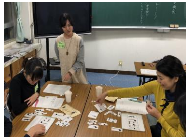
【リズムづくりの様子】

音楽の授業の導入部分で行っている『リズムリレー』を行いました。算数で使用する「おはじき板」を活用し、「音符カード」で自分のリズムをつくり、手拍子で表現しました。最後は、できた全員分のリズムをつなげ、すてきなリズムが完成しました。