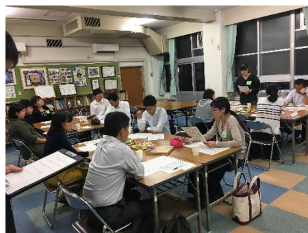
【児童の様子について質問をします】