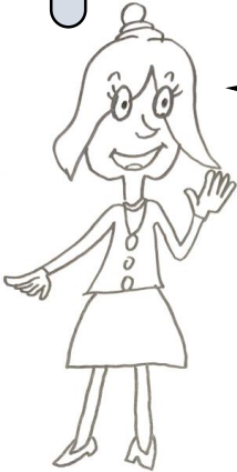
みなみ先生 採用 4 年目 若手世代