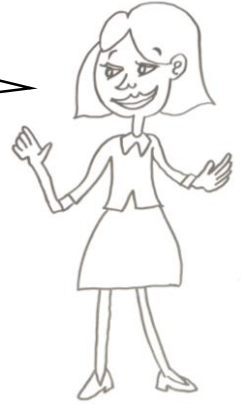
みどり先生 採用 8 年目 ミドル世代

若手からベテランの先生方と共に学び合うために、3 つ構成を取り入れ、幅の広いものにしています。時間が足りないと感じるかもしれませんが、お互いのネットワークを生かして、会以外でも交流をもったり、学習会で知ったことをきっかけにしたりして学びを深めていければいいなと考えています。