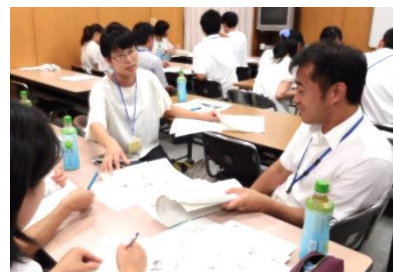
【グループごとに話し合う様子】

5、6人の小グループに分かれ、短い時間でしたがプリントのよさや作成の仕方、考え方についてなど話し合うことができました。